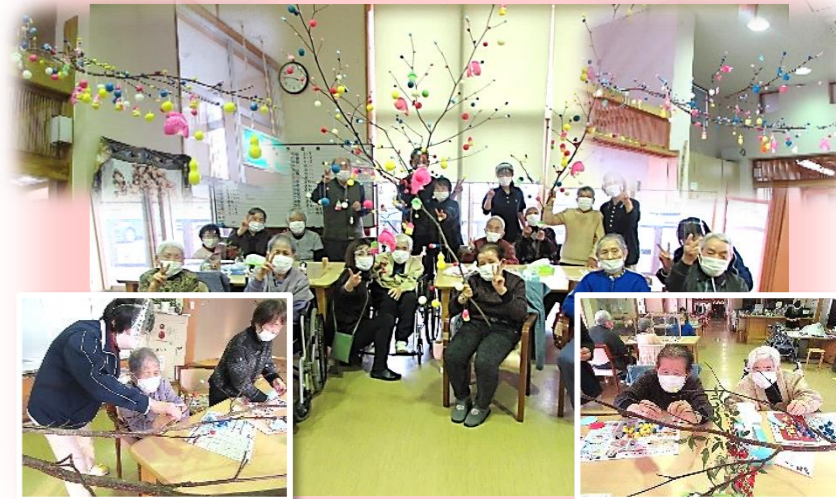
ちとせの屋内に色とりどりの団子の花が咲きました

小正月に会津の伝統行事である「団子刺し」作りをしました。みず木の新芽の枝に団子を刺し、豊作や家内安全、無病息災を祈りました。