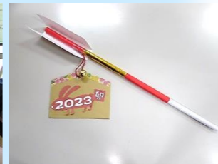
今年も笑顔で元気に過ごせる良い年になりますように...