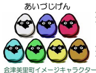
会津美里町イメージキャラクター

〒969-6402 大沼郡会津美里町 新屋敷字上深田甲1502 2025年1月発行